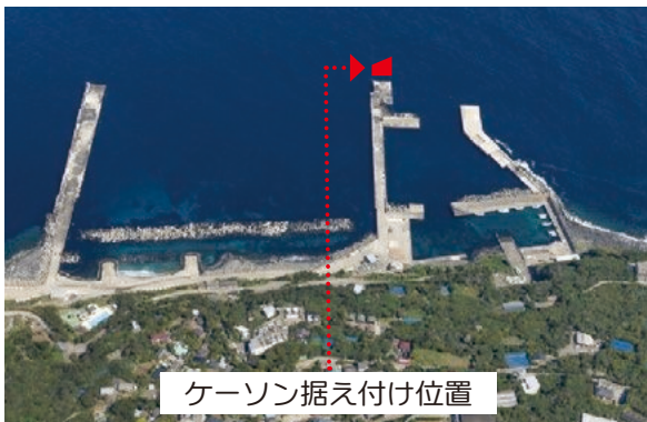
ケーソン据え付け位置