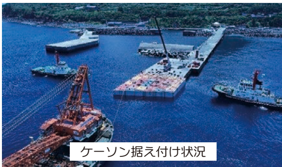
ケーソン据え付け状況