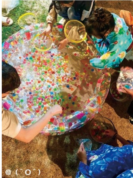
@ ( ' O ' )