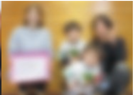
利島保育園入園式