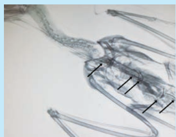
レントゲン写真 (矢印の位置に釣り針)

【問い合わせ】 大島支庁産業課林務担当 ☎(2) 4431 このウミネコは幸いにして助かりましたが、このような事故を防ぐためにも、釣りを楽しむ皆様には、使用後の釣り針や釣り糸は持ち帰り適切に処分していただくようお願いいたします。 今年の5月には、港でうずくまっていたウミネコが保護されました。レントゲン写真を見ると、このウミネコの胃の中には、5つもの釣り針が入っていました。数回にわたって手術を行い、釣り針を除去した後に、体力の回復を待つ放鳥することができました。