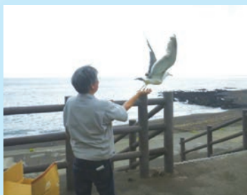
治療が終わり、放鳥されるウミネコ