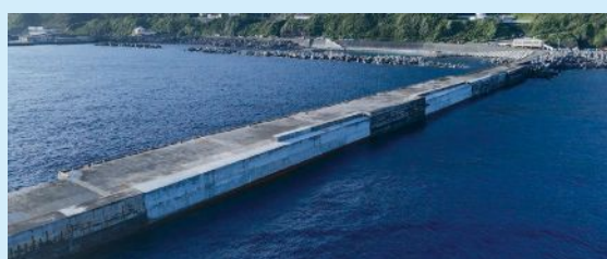
▲復旧が完了した護岸防波部

平成30年台風24号により、利島港では西側岸壁のケーソンがすべて滑動したほか、パラペットおよび上部コンクリートの破損など大規模な被害を受けました。利島港は島内唯一の港湾であり、島民の皆様のご生活や村の産業を支える基盤であることから、早期に利用できるように、段階的に復旧工事を進めてまいります。 令和元年11月末から暫定的に供用を開始した西側岸壁は、本年6月末に、岸壁の背後に位置する護岸防波部の復旧が完了し、より安全に岸壁を利用していただけになりました。今後は、最終段階として、岸壁先端部の復旧工事を進め、岸壁の全面復旧を目指してまいります。